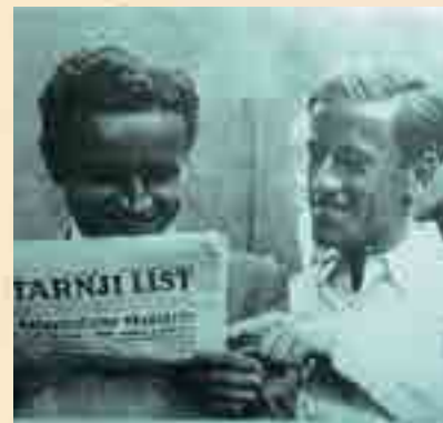
Punčec i Palada

Sklizačko društvo izgradilo je 1906. teniska igrališta u Mihanovićevoj ulici, gdje