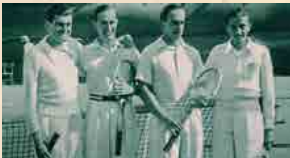
Susret parova: Hrvatska - Njemačka na Šalati 1936. Slijeva: Kukuljević, von Cramm, Henkel i Mitić

je 1909. održano prvo tenisko prvenstvo Hrvatske, Slavonije i grada Zagreba. Prvo tenisko prvenstvo Jugoslavije održano je u rujnu 1920. u Zagrebu, baš kao i sva buduća, sve do početka Drugoga svjetskog rata.