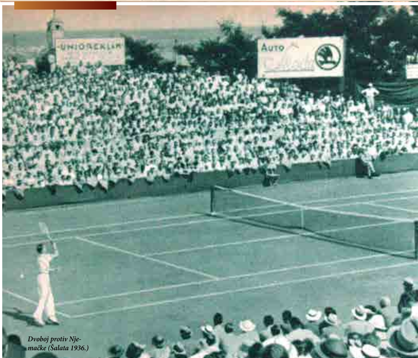
Dvoboj protiv Njemačke (Šalata 1936.)

N ajsnažniji osjećaji koje sam u životu ikad doživio bili su u Davis Cupu. To su nevjerojatne stvari - pobjede i porazi. Jednostavno vas pogode na jedan poseban način. Radi se o sasvim drugoj razini zadovoljstva, drugoj razini tuge - rekao je jednom prilikom argentinski tenisač David Nalbandian, dok se njegov američki kolega Frank Parker još davno pridružio na istu temu: „Nitko osim igrača ne zna kakve su muke u završnici Davis Cupa. Godine 1939., kada smo izgubili od Australije, nakon što smo vodili 2-0, trebalo mi je tjedan dana da se oporavim od fizičkih i psihičkih napora“.